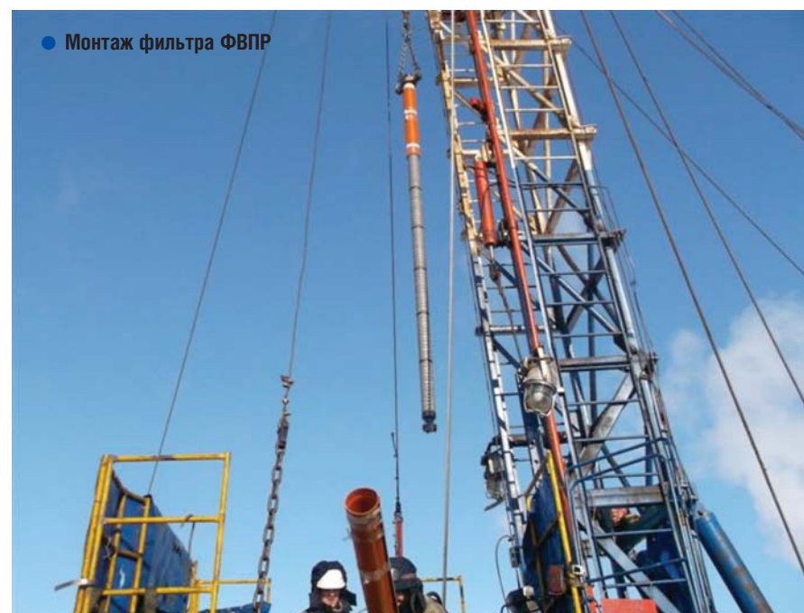
Монтаж фильтра ФВПР