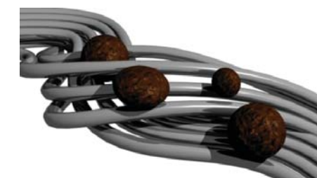
Рис. 1 Фильтрующие элементы на основе ППМ