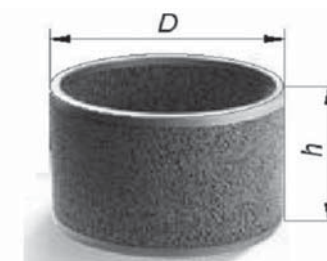
Рис. 2 Фильтроэлементы для скважинных фильтров

Освоенные ООО «РЕАМ-РТИ» ФЭ в габаритах 4, 5, 5А, 7А (рис. 2), нашли применение в семействах скважинных фильтров, подвесных и фильтров-входных модулей для УЭЦН, УШГН.